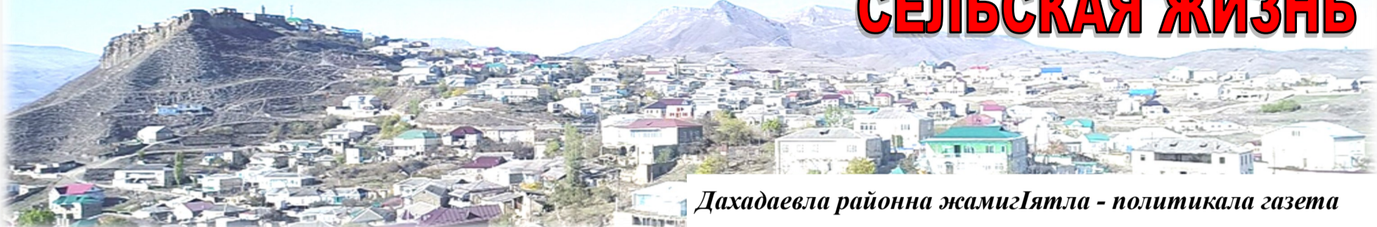
Дахадаевла районна жамигЯтла - политикала газета

№ 48 (8538) 2022-ибил дус. Декабрьла 2. ЖумягІ. Багъа 12 кьуруш 32 кепек