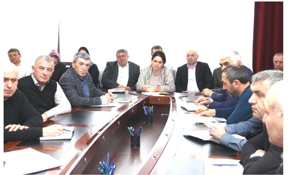
Планеркала ахирличир МяхIяммад ГIябдулкадиrowли совещаниела итогуни каиб ва балбуцла бутIакьянчичила гьала масьулти тIашдатур, илди гьунчидиркахьнила манзил кабизахьур. Информцентр.

Илкьайдали совещаниела дазурбазиб структурабала учреждениебала ва организациябала руководителтани арбякьунси жумягIлизир чуни дарибти хIянчила баянти гьаладихьиб, челябкьалализир дарестачилара гьанбушиб.