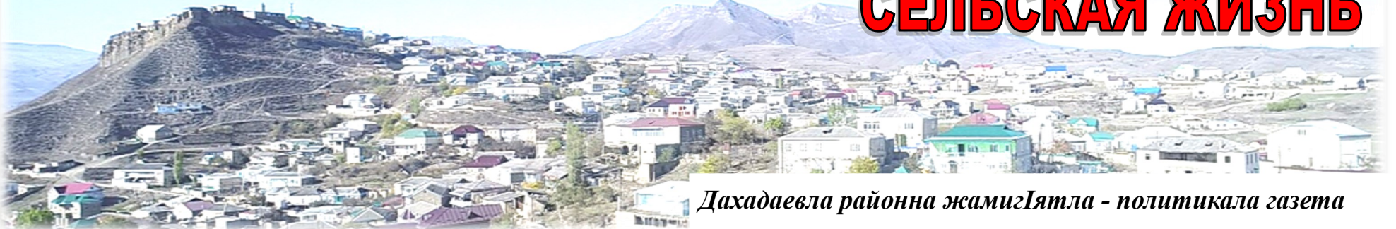
Дахадаевла районна жамигЯтла - политикала газета