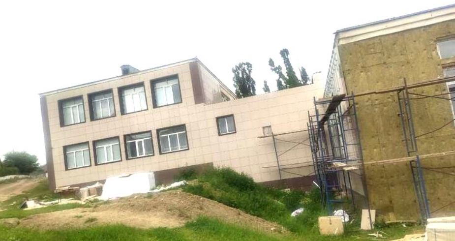
(Бехьибхьуд — 4-ибил бяхьлизиб)

Ил Кьизилюртлизив ца дилшахьанни узусири. Чячяй сунечил дарх касили лерри спиртра минеральный шинра. Шаихла (или бикьусири чячяйс), сунела гьай хьясибли, варг изусири. Гьар бархьли савли илини спиртла шуццали грамм бужули вири, илис гьергьи минеральный шинра. Шаихли илкьайдали сунела изути даргмахлис дарман диротири.